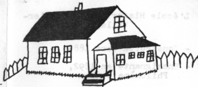
ECOLE HISTORIQUE DE CORMIER VILLAGE 1880